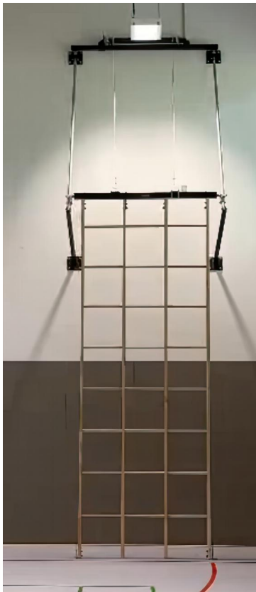
Gitterleiter 3fach elektrisch hochziehbar in Nutzungsstellung