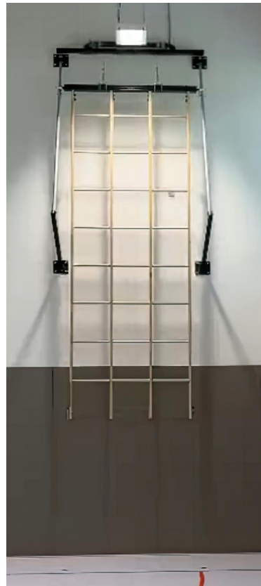
Gitterleiter 3fach elektrisch hochziehbar in Parkstellung